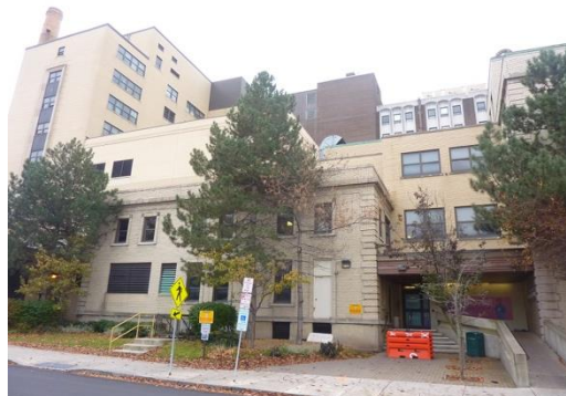
IDENTIFIER: C Building