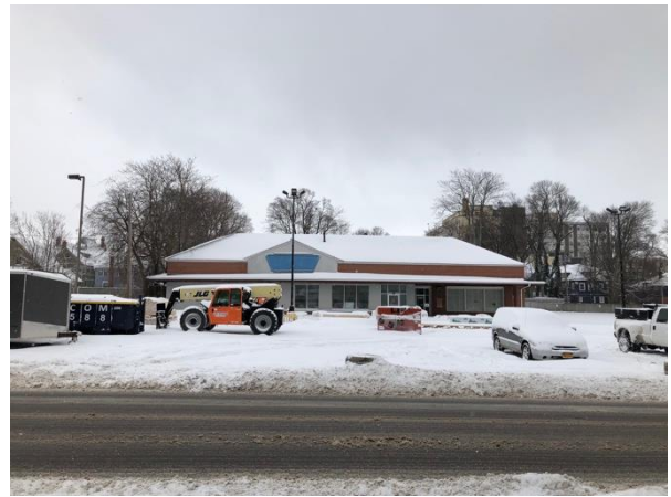
IDENTIFIER: 204 W Utica