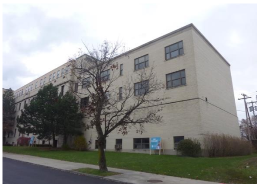
IDENTIFIER: MH Building